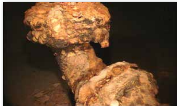
Korrosion på rörarmaturer i tanken. Risk föreligger att korrosionsprodukter skapar igensättningsproblem.

SBF 120:7 (jan 2011): Tio-årskontroller av tank/ bassäng ska utföras så att dess invändiga skick och behov av åtgärder kan bedömas på ett entydigt sätt. Detta kan utföras efter tömning eller utan tömning av bassäng eller tank. Rengöring och underhåll av ytskikt ska göras efter det behov som noterats vid kontrollen.