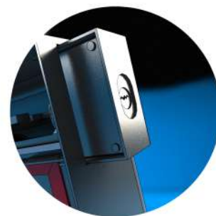
Infällt sabotageskyddat hänglås klass 3