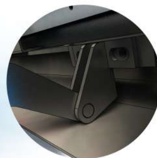
Brytskyddade och dolda detaljer