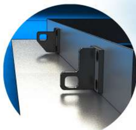
Dubbla låspunkter för ökad säkerhet